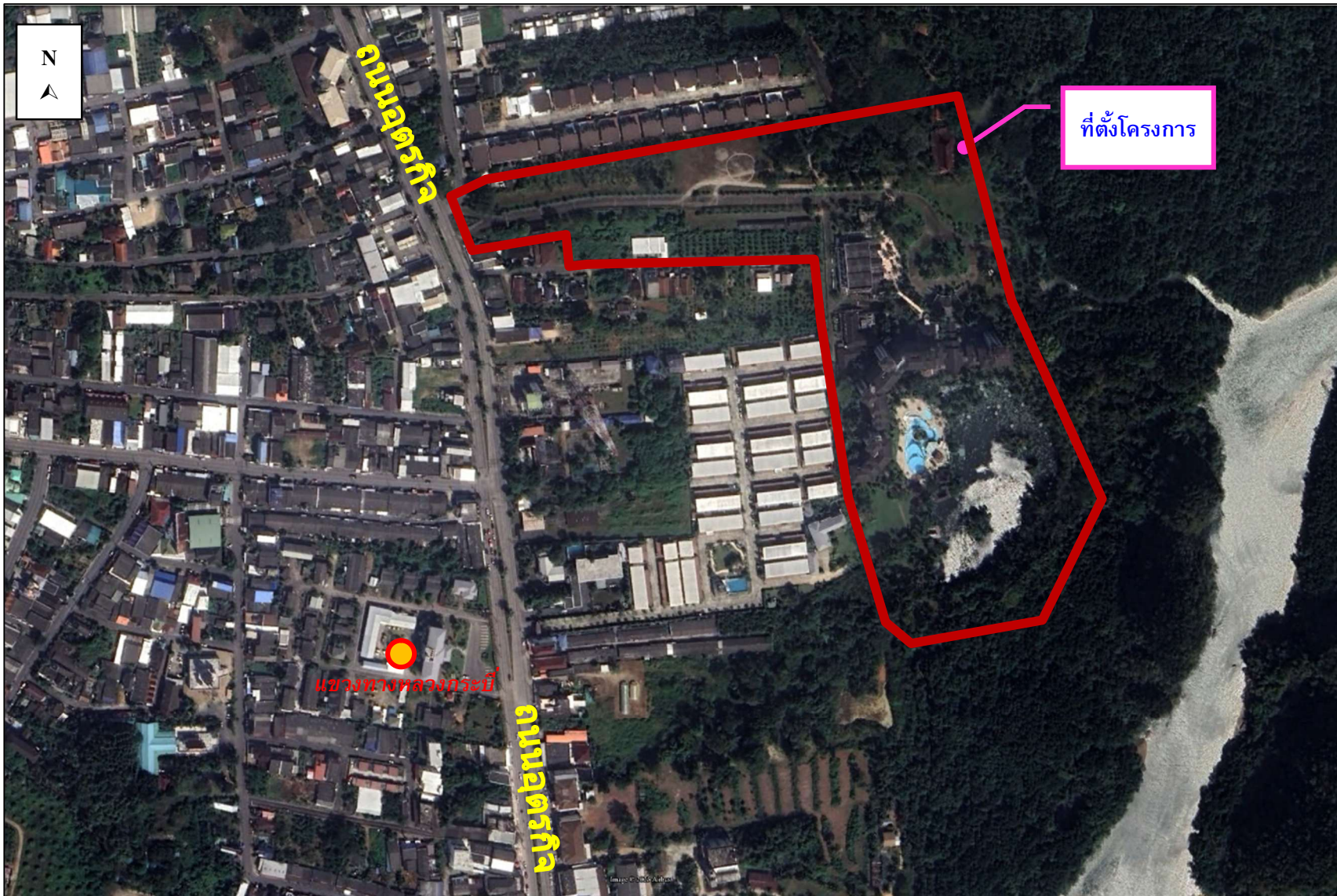
รูปภาพที่ 1.1 สถานที่ตั้งโครงการ